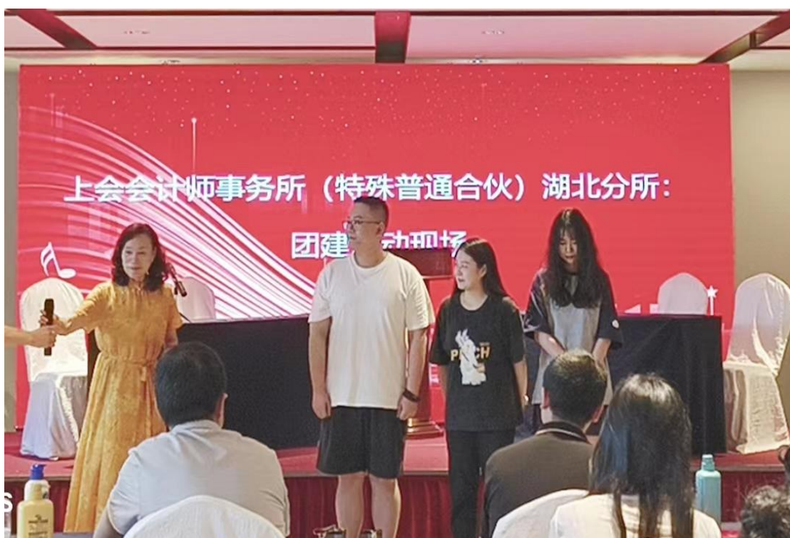
（所领导为参与方颁奖）