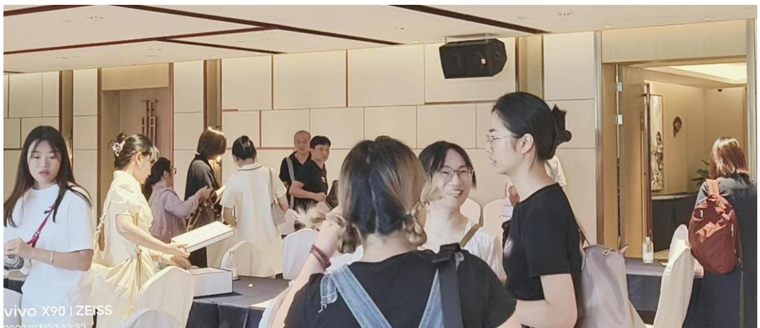
经过 15 分钟的答题和小组讨论，最终确认答案。