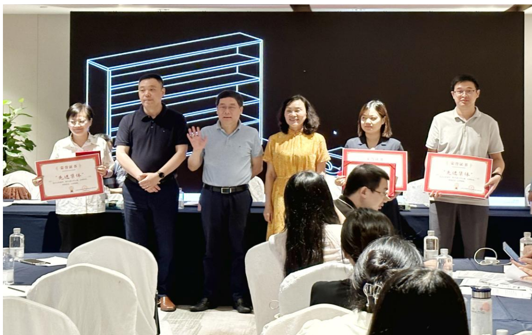
（首席和领导颁发先进集体奖）