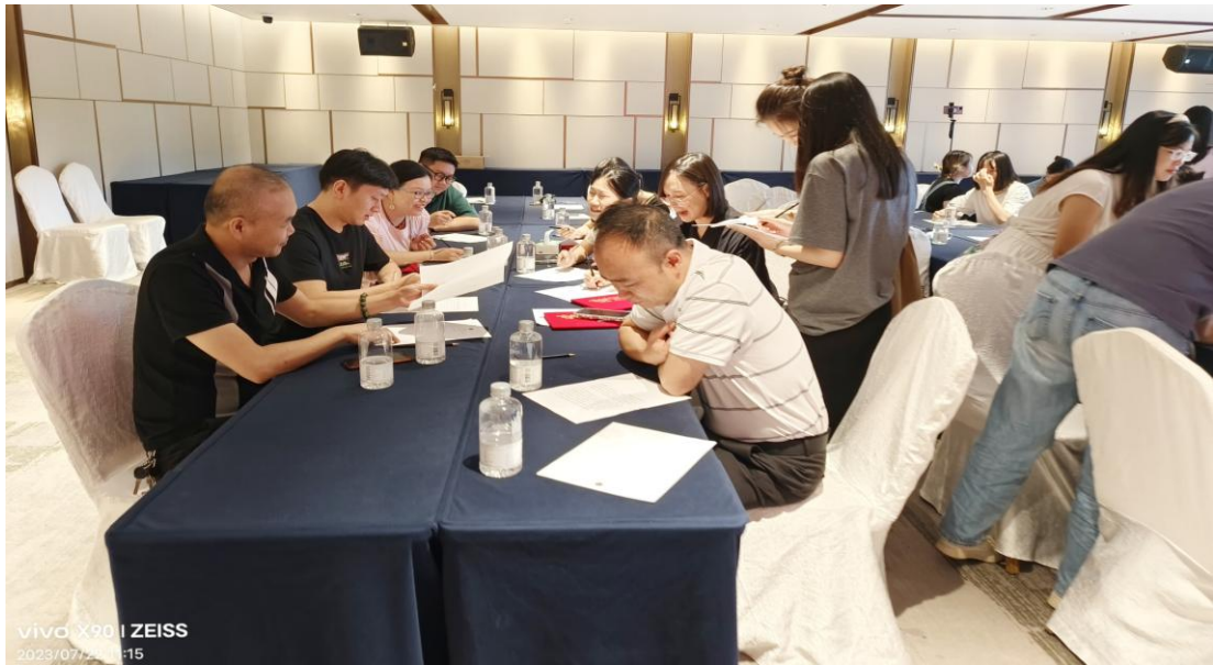
分组进行各自答题，并进行热烈的研究和沟通。