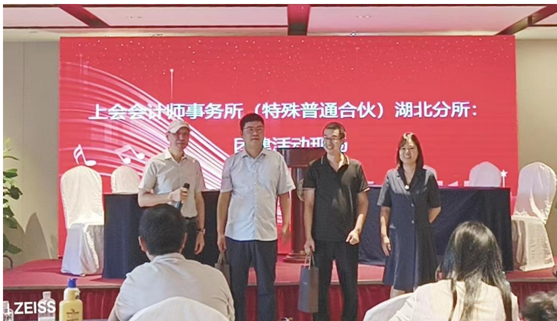
（所领导为获胜方颁奖）